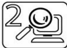
Backup startet automatisch